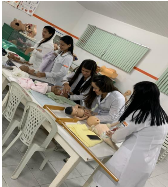
Imagem 1 – Monitoria prática de Saúde da Criança, Laboratório de enfermagem II. 2024

SENA, E. M. M. et al. Perfil sociodemográfico e profissional de enfermeiros graduados de um programa de acompanhamento acadêmico. Rev Enferm UFPI , v. 11, p. e2630, 2022. disponível em: https://periodicos.ufpi.br/index.php/reufpi/article/view/2630/2556 . Acesso em: 14 out. 2024.